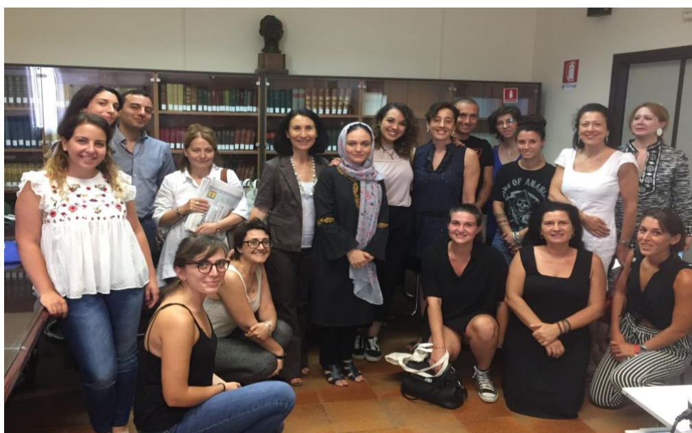
La classe 2017 – I edizione

Alla fine del percorso, ogni partecipante è chiamato a preparare un lavoro finale supportato dall’assistenza di un tutor. Il lavoro finale è presentato di fronte a un’apposita Commissione giudicatrice e dà diritto al conseguimento del titolo e all’attribuzione di 8 crediti formativi universitari . A conclusione del percorso, si tiene la cerimonia di consegna dei diplomi .