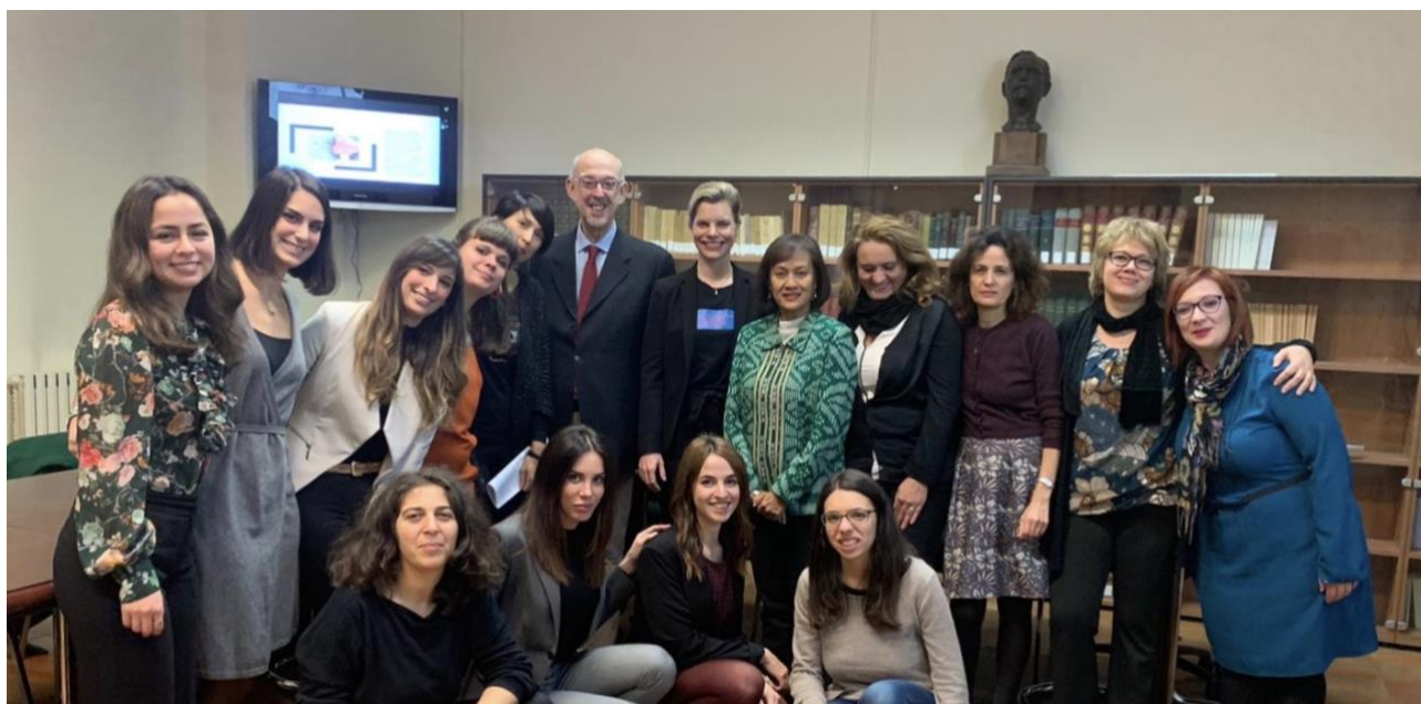
La classe 2018 - II edizione

Possono partecipare al Corso di alta formazione coloro che sono in possesso di laurea di primo livello , laurea specialistica, magistrale o laurea di ordinamento precedente al DM 509/99. Inoltre, possono accedere al Corso gli studenti in possesso di titoli di studio rilasciati da Università straniere, che presentino il diploma corredato di traduzione ufficiale in lingua italiana con legalizzazione e di dichiarazione di valore, in conformità alla circolare del Ministero dell'Università, dell'Istruzione e della Ricerca del 2 agosto 2017.